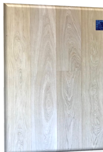
Rovere Comm. EVO